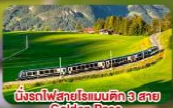
นั้งรถไฟสายโรแมนติก 3 สาย Golden Pass / Luzern Interlaken Express / Gornergrat