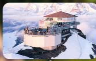
ทานอาหารที่ Piz Gloria กั้ตตาคารที่หมุนได้ 360 องศา