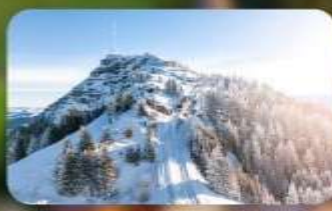
พิชิต 3 ยอดเขาคิง Rigi / Schilthorn / Gornergrat