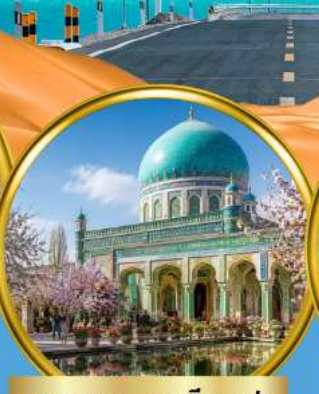
สุสานสมหอมเซียนเฟย