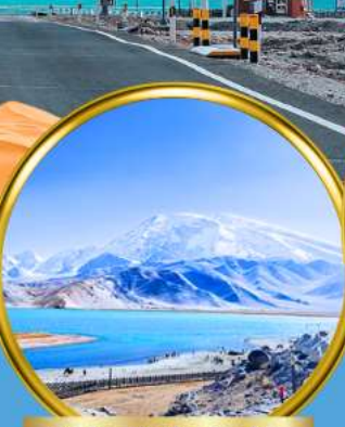
Kala Kule Lake