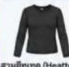
สวมฮีทเทค (Heattech) แบบหนาพิเศษด้านใน