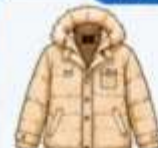
เสื้อโค้ทกันหนาว ตัวหนา