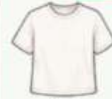
เสื้อยืด