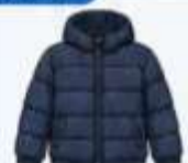
เสื้อขนเป็ด