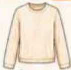
เสื้อแขนยาว