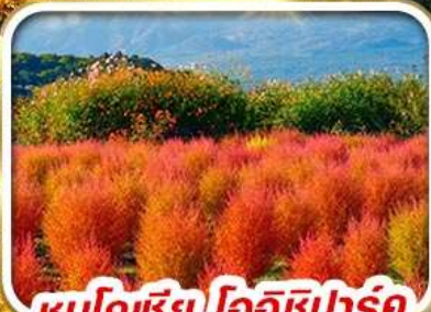
ชมโคเชีย โออิชิปาร์ค