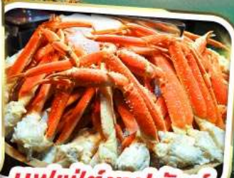
บุฟเฟ่ต์ซาปูยักษ์