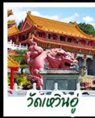
วัดเหวินอู๋