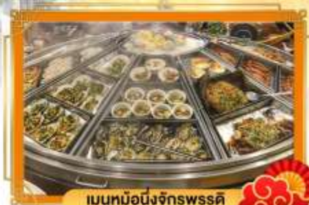
เมฆหมอกนึ่งจักรพรรดิ