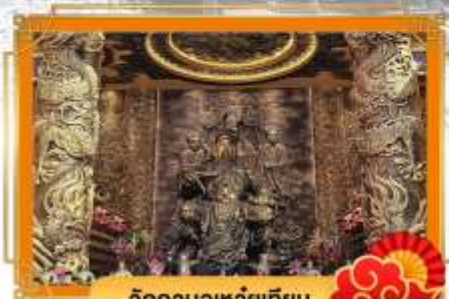
วัดกวนอูเหวยเทียน