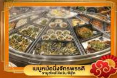
เมนูหม้อไฟจักรพรรดิ