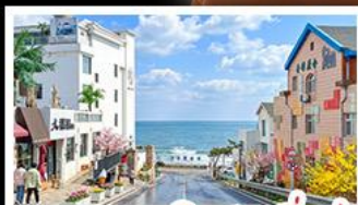
ถนนคอปเปลิ่งสาขาที่เปิด