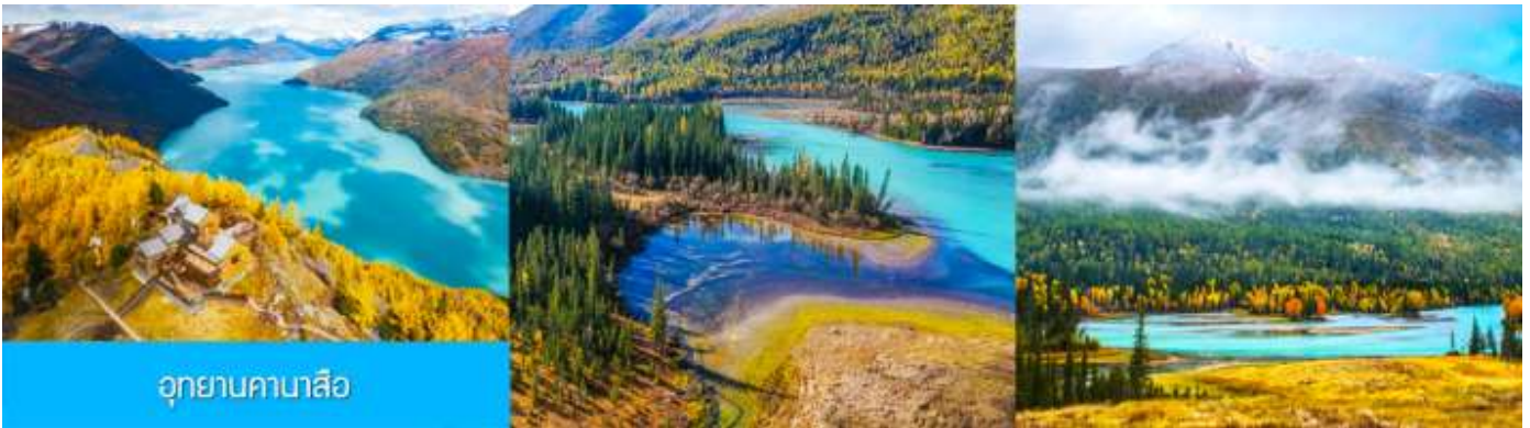
อุทยานคานาสี

รับประทานอาหารกลางวัน ณ ร้านอาหารในเขตอุทยานฯ (8)