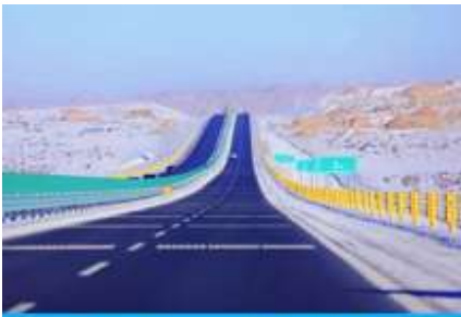
S21 DESERT HIGHWAY

21.26 น. ขบวนรถไฟเดินทางถึงสถานีรถไฟเมืองอูรูมูฉี นำท่านเดินทางสู่โรงแรมที่พักในเมืองอูรูมูฉี พักที่ HOLIDAY INN EXPRESS HOTEL โรงแรมระดับ 4 ดาวห้องดีน หรือเทียบเท่าในเมืองอูรูมูฉี