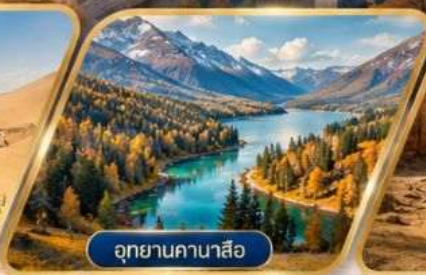
อุทยานคานาสีอ