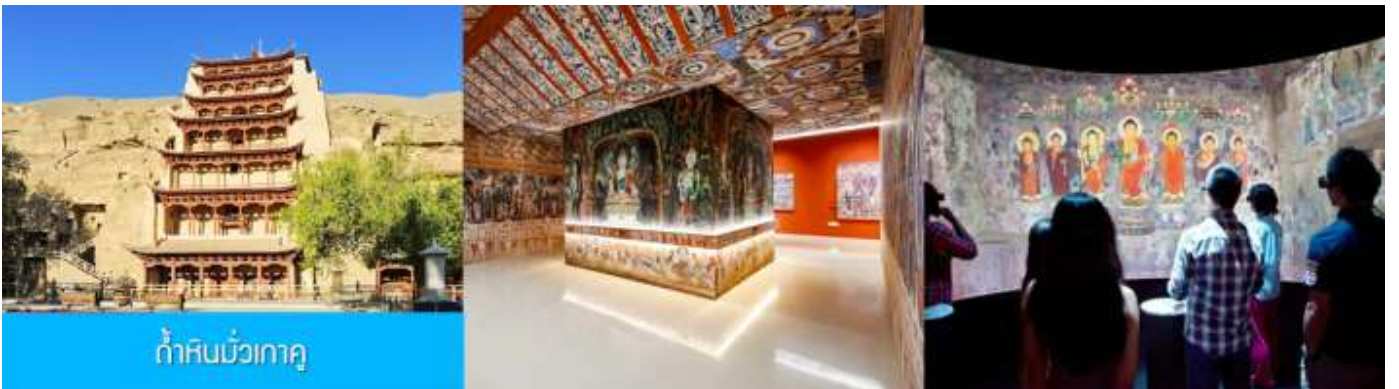
ถ้ำหินมั่วเกา

เช้า รับประทานอาหารเช้า ณ ห้องอาหารของโรงแรม (1)