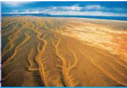
ทะเลทรายกู่เอ๋อปีนทงกู่เอ๋อ