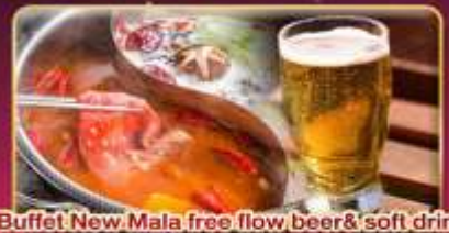
*Buffet New Mala free flow beer & soft drink