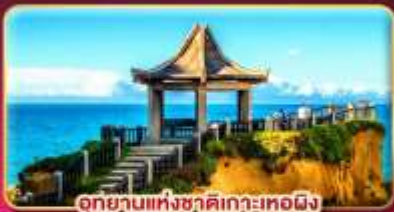
อุทยานแห่งชาติเกาะหม้อผิง

ชมเทศกาลข้ามปี ฉลองเทศกาลปีใหม่ของ 2027 แช่น้ำแร่ส่วนตัวในห้องพัก