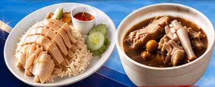
ข้าวมันไก่ปีนัง