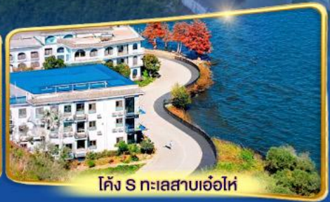
โค้ง S ทะเลสาบเอ๋อไห่