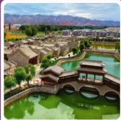
หมู่บ้านตันเซียโซ่ว