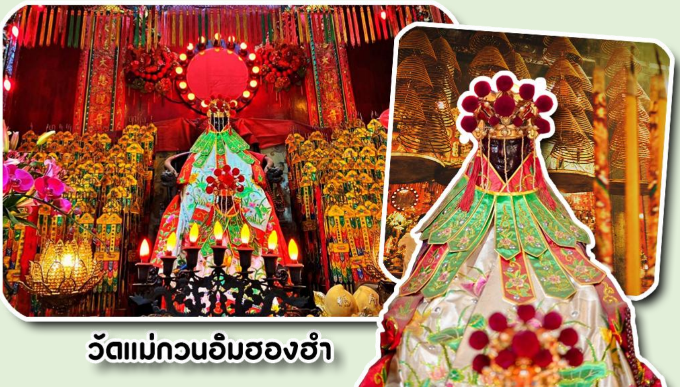
วัดแม่กวนอิมฮ่องฮำ

พาท่านเดินทางไปไหว้ขอพรขอเงิน วัดแม่กวนอิมฮ่องฮำ วัดเก่าแก่ของฮ่องกงสร้างตั้งแต่ปี ค.ศ. 1873 เป็นวัดขนาดเล็กที่มีชาวฮ่องกงศรัทธาแน่นถือกันเป็นอย่างมาก วัดแห่งนี้เป็นที่ประดิษฐาน องค์เจ้าแม่กวนอิมฮ่องฮำ ที่มีชื่อเสียงเรื่องการให้กู้ยืมเงิน เชื่อกันว่าท่านช่วยพลิกฟื้นเศรษฐกิจของชาวฮ่องกง ผู้คนจึงนิยมมาขอยืมเงินทำธุรกิจจนสำเร็จร่ำรวย รุ่งเรือง โดยให้ท่านอธิษฐานขอพรต่อหน้าเจ้าแม่กวนอิมฮ่องฮำ พร้อมกับระบุวันเวลาในการขอพรด้วย จากนั้นนำธูปธูปตามฐานะและศรัทธาที่เราจะนำเป็นสื่อในการขอพร เขียนจำนวนเงินที่ต้องการลงไปด้วย ใส่สกุลเงินยี่งดีใหญ่ แล้วนำเงินใส่ในซองแดง ควรเตรียมซองแดงไปเอง นำซองแดงไปวนรอบกระถางธูป วนขวาจำนวน 3 ครั้ง แล้วเก็บซองแดงในกระเป๋าสตางค์ เป็นเงินขวัญถุง ถ้าประสบความสำเร็จตามที่มุ่งหวัง ให้นำเงินในซองแดงทำบุญหยอดตู้ที่วัดแห่งนี้ในโอกาสต่อไป วิธีไหว้ให้ปัง ให้ได้โชคลาภเงินทอง ต้องไปกับเราเท่านั้น