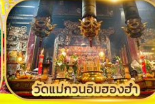
วัดแม่กวนอิมสองอ่า