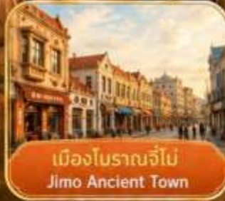
เมืองโบราณจี้โม Jimo Ancient Town