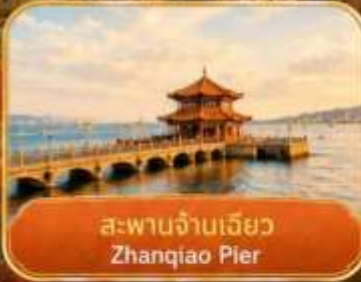
สะพานจันเจียว Zhanqiao Pier