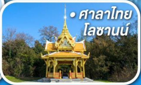
• ศาลาไทย ไอชานน์

• สุดอากาศดีที่เซอร์แมท • ขึ้นกระเช้าสู่ยอดจากลาเซียร์ 3000 • ชมเมืองคลาสสิกเบิร์น ลูเซิร์น ซูริก