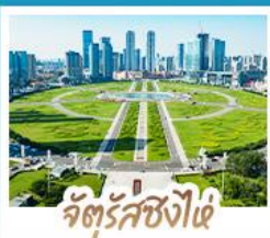
จัตุรัสซิงไผ่