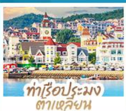
ท่าเรือประมง ต้าเหลียน