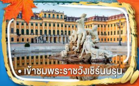
• เข้าชมพระราชวังเซิร์นบรุน