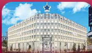
ชานซองซู