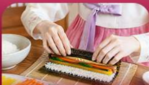
เรียงทำคิมบับ

สัมผัสเสน่ห์ฤดูหนาวของเกาหลีแบบอบอุ่นหัวใจพิเศษ! พักสกีรีสอร์ท 1 คืน ท่ามกลางบรรยากาศที่โรแมนติก สวยงามกับกิจกรรมฤดูหนาวยอดนิยม ทั้งสกี สโนว์บอร์ดและสโนว์สเลด ก่อนออกเดินทางสู่เกาะนามิ ดินแดนแห่งความโรแมนติก ซิมสตรอว์เบอร์รี่หวานฉ่ำ สด ๆ จากฟาร์ม พร้อมเรียนทำคิมบับเมนูยอดฮิตสไตล์เกาหลี ปิดท้ายด้วยการช้อปปิ้งสินค้าเมืองคยองและซองซู ย่านอิคทีสายคาเฟ่และสายแฟชั่นห้ามพลาด