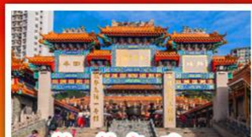
วัดเซ่งเตงต้าเซียน

วัดเจ้าแม่กวนอิมฮ่องฮำ - กระเช้านองปิง พระใหญ่ไโป่วหลิน - เจ้าแม่กวนอิมรพิลส์เบย์ วัดเซ่งเตง - วัดหวังต้าเซียน - วัดเจ้าแม่ทับทิม