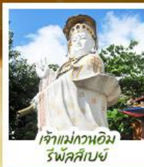
เจ้าแม่กวนอิม รีฟัลส์บีย์