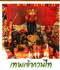
เทพเจ้ากวนไท