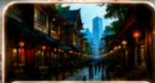
หมู่บ้านโบราณฉือซีโซ่ว