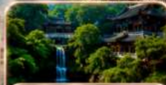
ถนนโบราณเจียฟางเป่ย์