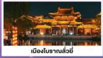
เมืองโบราณลั่วयी