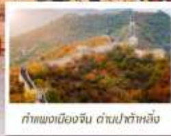
กำแพงเมืองจีน ด้านป่าหิมะ