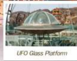
UFO Glass Platform