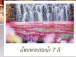
น้ำตกทะเลสาบที่ 7 สี

🗳️ โหลด 23 KG. x1 ทิ้งไป - กลับ ✓ ฟรีมัสมั ✗ ไม่เข้าร้านรัฐบาล ✓ ทิวทัศน์เล็ก ✓ รวมค่าเข้าชมตามที่ตามโปรแกรม