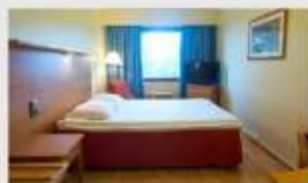
Double สำหรับ 2 ท่าน