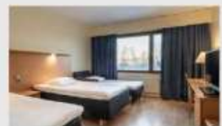
Triple สำหรับ 3 ท่าน