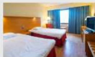
Twin สำหรับ 2 ท่าน