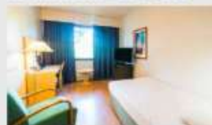
Single สำหรับ 1 ท่าน