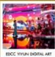
EDCC YIYUN DIGITAL ART