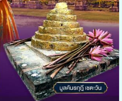
มูลคันธกุฎี เขตเววัน