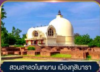
สวนสาละวินทยาน เมืองกุสินารา