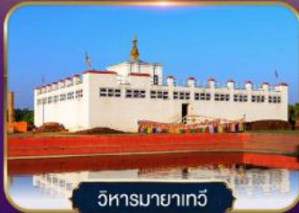
วิหารมายาเกวี