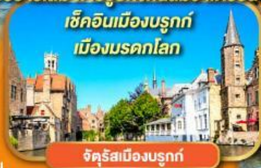
จัตุรัสเมืองบรูกก์