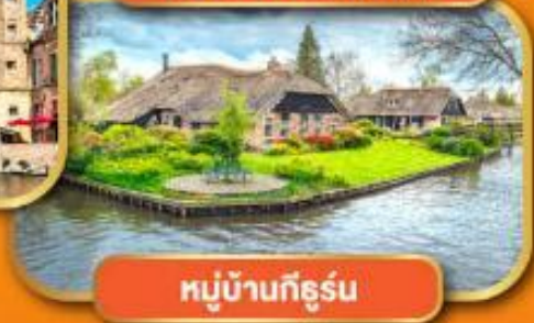
หมู่บ้านกัธูร่น