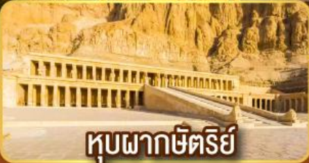
คูบผากษัตริย์