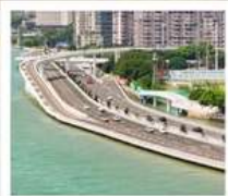
สะพานเหยียนหู่เฉียว