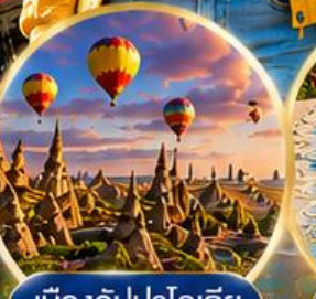
เมืองคัปปาโดเกีย Cappadocia