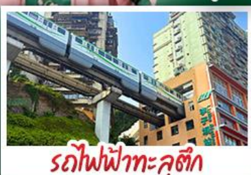
รถไฟฟ้าทะเลสุติก