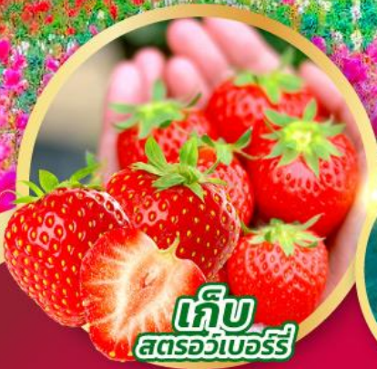
เก็บ สตรอว์เบอร์รี่