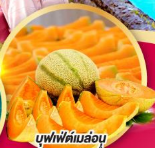
บุฟเฟ่ต์เมล่อน หอมหวานฉ่ำ