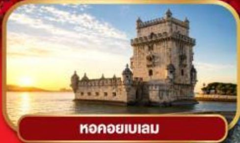
ทอคอยเบเลม