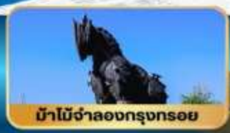
ม้าไม้จำลองกรุงทรอย