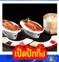
เปิดปิกกิ้ง