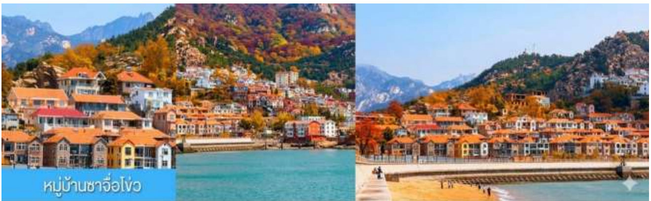
หมู่บ้านซาจื่อโ้ว

พักที่ WEIHAI BOYUE HOTEL / WEIHAI JIANGUO PUYIN โรงแรมระดับ 4 ดาวท้องถิ่นเมืองเวย์ไห่