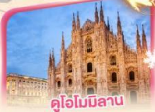
คูโอโมมิลาน