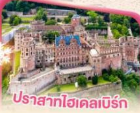
ปราสาทไฮเคลเบิร์ก