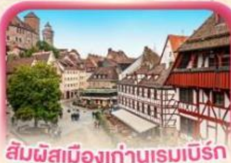
สี่มผัสเมืองเก่าบูเรมเบิร์ก