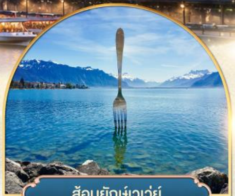
ล้อมยึกเขาวัว