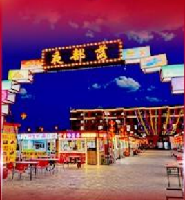
ตลาดกลางคืน ทาลาเดอซี