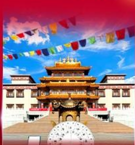
วัดพระโพธิสัตว์ ดูลาน