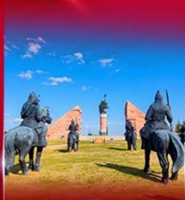
สวนสาธารณะเจงกิสข่าน