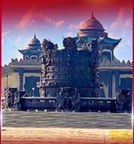
ศูนย์วัฒนธรรม มองโกเลีย หยวนหลิว