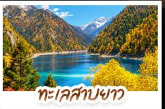
ทะเลสาบขาว