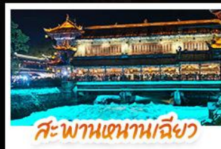
สะพานเทพานเจียว