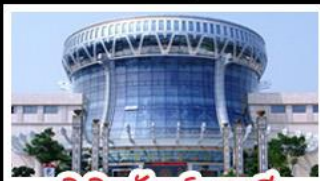
พิพิธภัณฑ์ทิวาสี

สวนสนุก FANTASYLAND - หมู่บ้านสไตล์ยุโรป พิพิธภัณฑ์ทิวาสี - ถนนคนเดินสามตรอกสองซอย ท่าเรือกิ่งจ้อ - ศาลเจ้าแม่กวนอิมพันกร เมนูพิเศษ อาหารทิวาสี, สุกีชาบูหม่าล่า