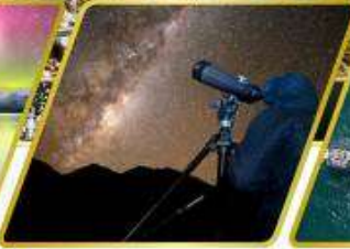
กิจกรรมชมทิวทัศน์ดาว