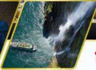
ล่องเรือมิลฟอร์ด ซาวน์