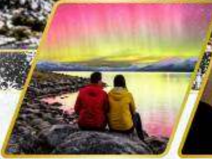
ตามล่าหาแสงใต้