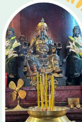
วัดปุกโตฮองฮำ