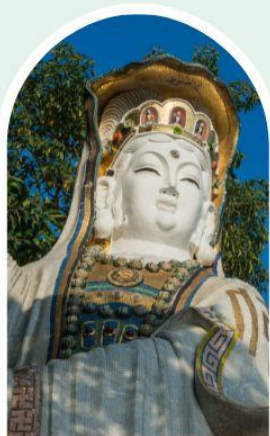
เจ้าแม่กวนอิม ธิพลสัย