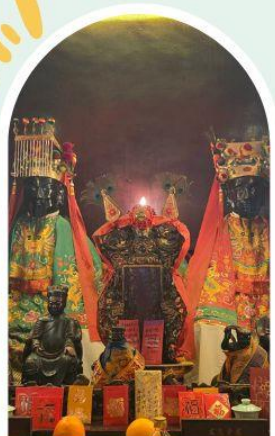
วัดหมิ่นโหมว