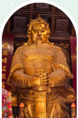
วัดเซกวง

"ไหว้พระ เสริมดวง เพิ่มสิริมงคลแก่ชีวิต"