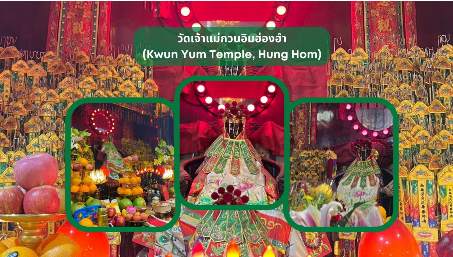
วัดเจ้าแม่กวนอิมฮ่องกง (Kwun Yum Temple, Hung Hom)

เช้า รับประทานอาหารเช้า ณ ภัตตาคาร บริการท่านด้วยเมนูติ่มซำฮ่องกง (มื้อที่ 3)