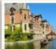
เวนิสแห่งต้าเหลียน