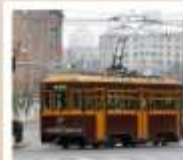
นั่งรถรางชมเมืองต้าเหลียน