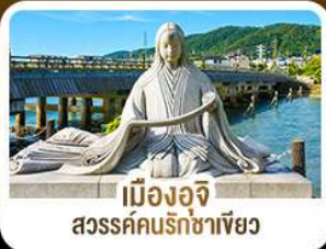
เมืองอจิจิ สวรรค์คนรักชาเขียว