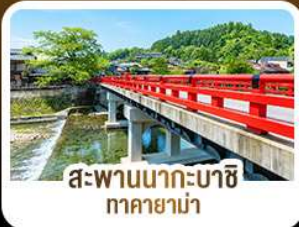
สะพานนากะบาชิ ทาคายาม่า