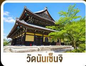
วัดนันเซ็นจิ