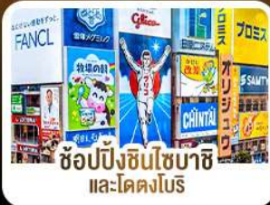
ช้อปปิ้งชินโซบาชิ และโดตงโบริ