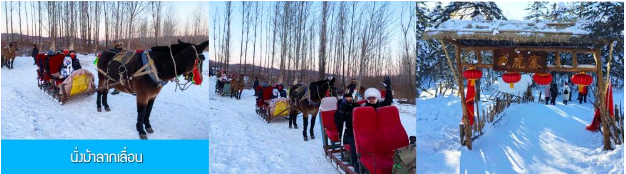
นั่งม้าลากเลื่อน