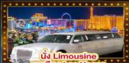
นั่ง Limousine ชมเมือง Las Vegas