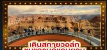
เดินสกายวอล์ก ชมแกรนด์แคนยอน