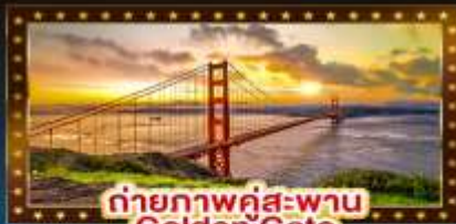
ถ่ายภาพคู่สะพาน Golden Gate