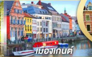
เมืองเกนต์