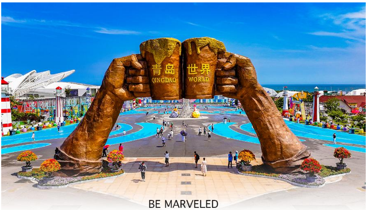
BE MARVELED QINGDAO INTERNATIONAL BEER FESTIVAL

หลังรับประทานอาหารเช้า นำท่านนั่งรถผ่าน อุโมงค์ใต้ทะเลไปเขตชิงเต่าซีอันเหวียน จากนั้นนำท่านเดินทางไป QINGDAO INTERNATIONAL BEER FESTIVAL เทศกาลเบียร์นานาชาติชิงเต่าหรือเทศกาลเบียร์ขนาดใหญ่และมีชื่อเสียงที่สุดงานหนึ่งในเอเชีย จัดขึ้นเป็นประจำทุกปีที่เมืองชิงเต่า มณฑลซานตง ประเทศจีน โดยมีกิจกรรมที่หลากหลาย เช่น การดื่มเบียร์จากหลายประเทศ การแสดง แสง สี เสียง คอนเสิร์ต สวนสนุก และการแข่งขันต่างๆ เทศกาลนี้ได้รับความนิยมจากทั้งนักท่องเที่ยวชาวจีนและชาวต่างชาติ และมีเบียร์จากกว่า 40 ประเทศทั่วโลกเข้าร่วม