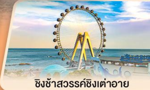
ชิงซ่าสวรรค์ซิงต้าอายุ